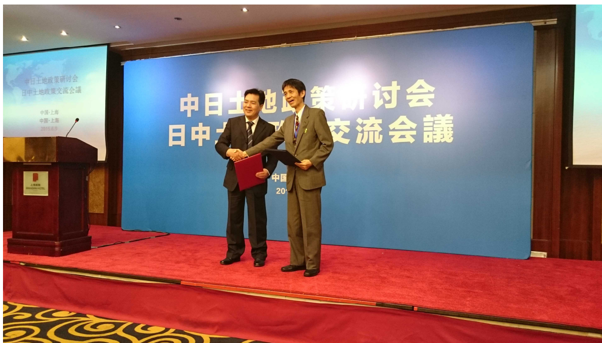
▲覚書の更新（右：長谷川土地・建設産業局次長、左：白科学技術・国際合作司副司長）