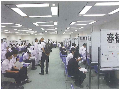
▶ 昨年の会場の様子