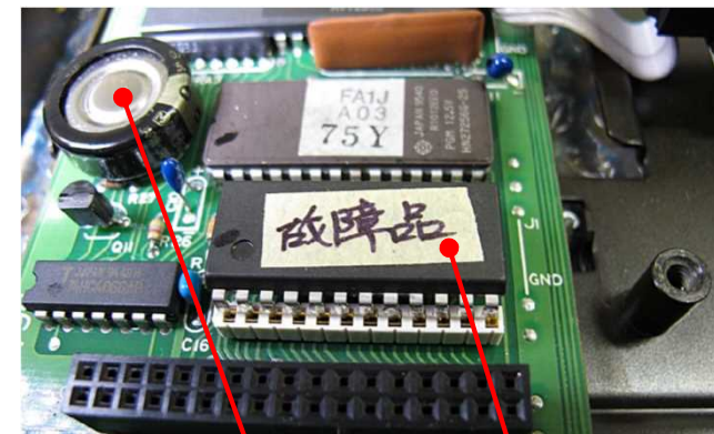
RAMバックアップ用 コンデンサ