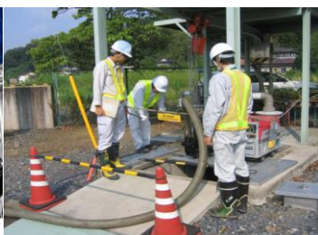
下水道BCPの策定による栃木県内自治体間の連携強化 (栃木県)