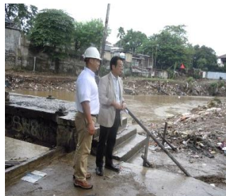
下水道管理設技術(推進工法)をインドネシア洪水対策事業(地下放水路建設)に適用(機動建設工業(株)・ヤスタエンジニアリング(株)・(株)イセキ開発工機 共同企業体)