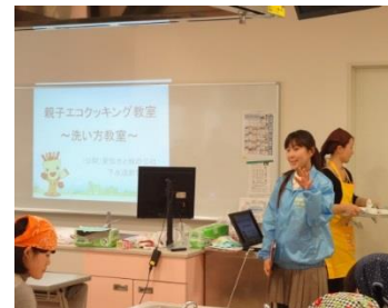
台所から学ぶ下水道(公益財団法人愛知水と緑の公社)