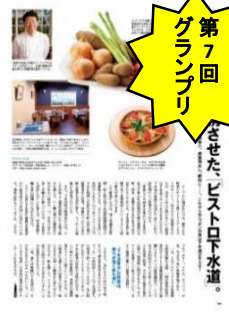
下水道資源の有効利用「ビストロ下水道」の紹介（雑誌「Pen+（ペン・プラス）」『下水道のチカラ』制作プロジェクト）