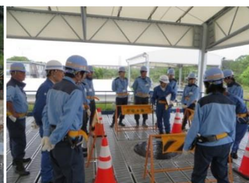
下水道技術実習センター整備事業 (日本初の下水道技術専門の大型実習施設) (東京都下水道局)