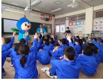
千曲市「魅せる下水道」プロジェクト (千曲市)