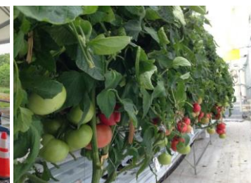
豊川バイオマスパーク構想 (豊橋技術科学大学、愛知県)