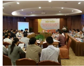
先進的省エネ型下水処理システム(前ろ過散水ろ床法)の開発(メタウォーター株式会社)