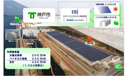
こうべWエコ発電プロジェクト (神戸市)