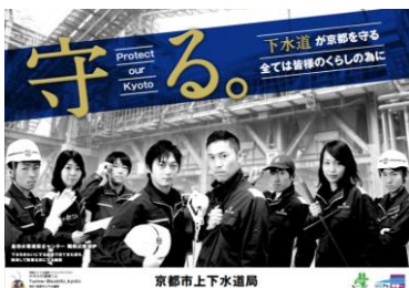
下水道PRポスター (京都市上下水道局)

http://www.mlit.go.jp/mizukokudo/sewage/crd_sewage_tk_000085.html