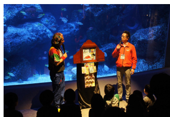
(株) 浜野製作所 浜野社長による講演