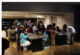
海と船のキッズ教室