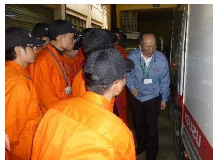
(物流マネジメント研修の様子:ホーチミン交通大学)