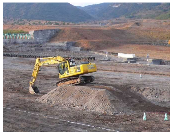
走行検証状況(マウンド部)