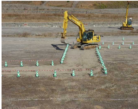
走行検証状況(走行路部)