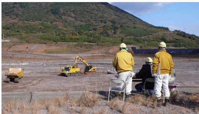
目視による掘削実施状況