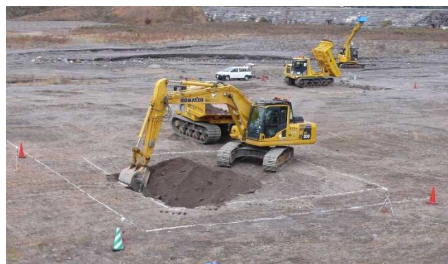
遠隔操縦機を用いた掘削・運搬状況