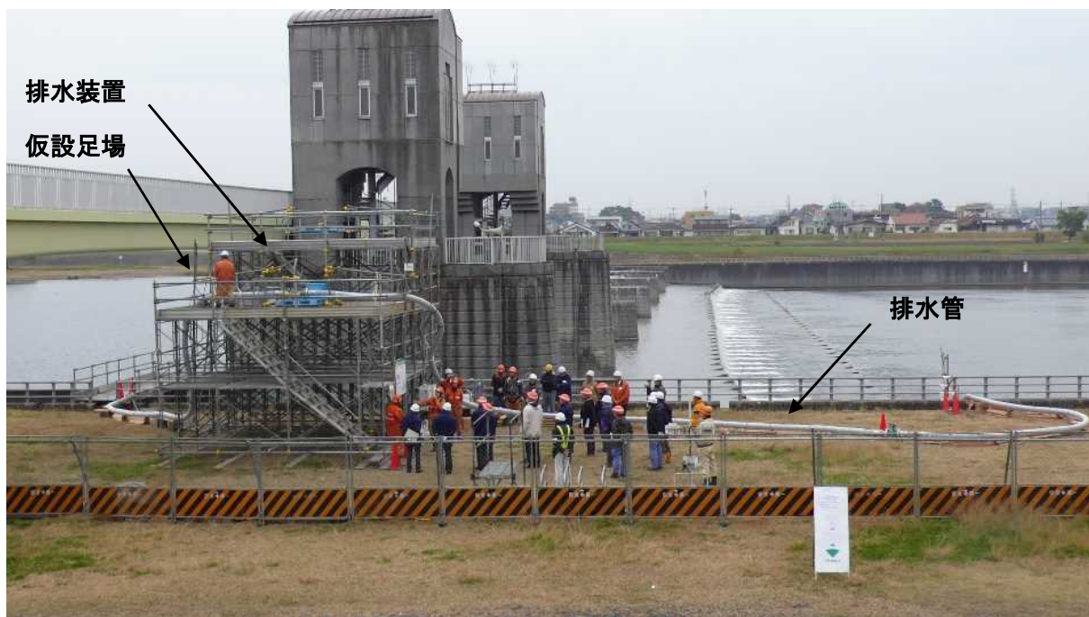
排水作業 現場検証状況