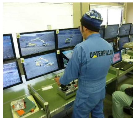
カメラ車からの映像による掘削実施状況