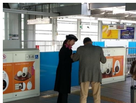
上段: 全て東京モノレール