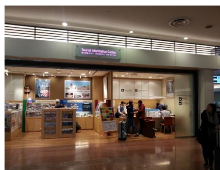
下段: 左 京浜急行電鉄 中: 空港ターミナル内 右: 空港ターミナル内