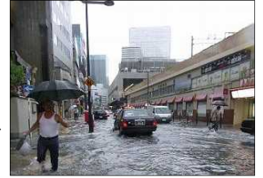
平成25年8月大阪市梅田駅周辺での浸水