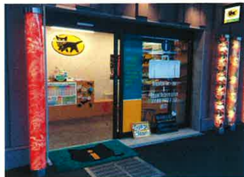
〈嵐山 嵐電嵐山駅センター〉