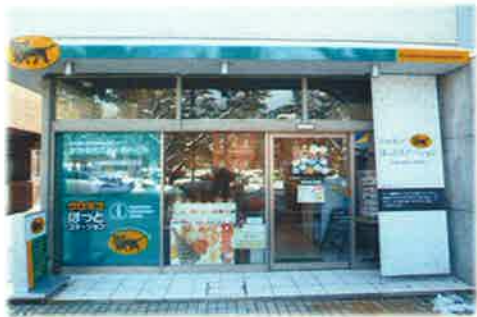
〈金沢 クロネコほっとステーション〉