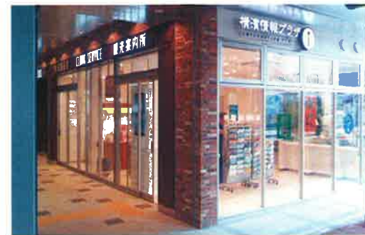
〈横浜 桜木町駅観光案内所〉