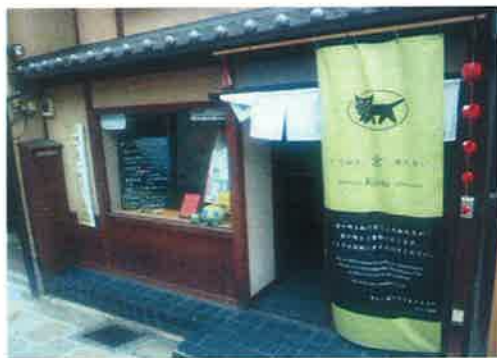
〈祇園 くろねこ京あない〉