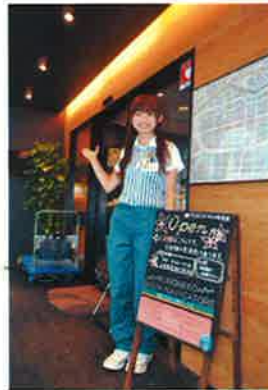
〈銀座 紺屋橋センター〉