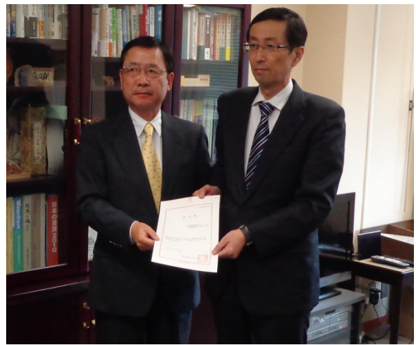
関係者 [左]川端社長(※) [右]港湾局長 ※阪神国際港湾株式会社 代表取締役社長