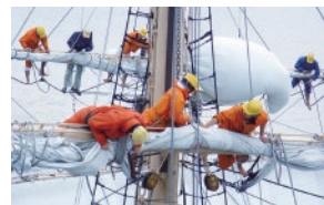
航海科実習（帆船訓練）

船を動かすにはチームワークが大切。厳しい訓練の合間に仲間との交流を深めながら船内生活を送ります。