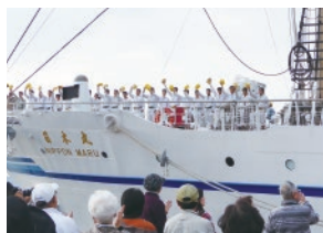
練習船日本丸出港の様子