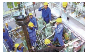
機関科実習（主機ピストン抜き出し整備）