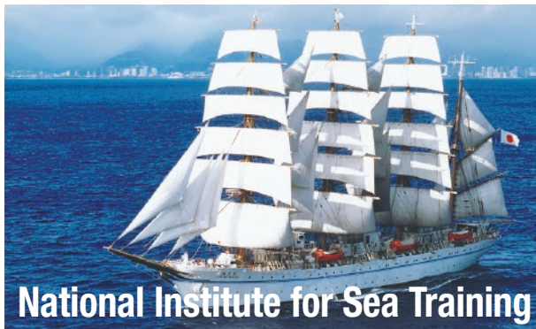
National Institute for Sea Training