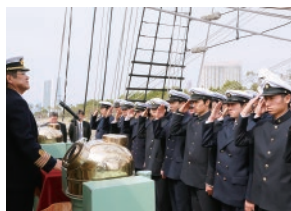
将来活躍が期待される学生たち

練習船実習をとおし、船員として求められる資質、知識および技能を兼ね備えた優秀な人材を育成し、国内外の海上輸送の安全と安定を目指しています。船員は世界および日本各地の風景を見られる素晴らしい夢のある職業です。