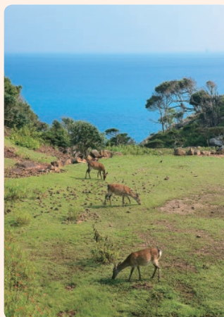
人がいなくなった島は野生のシカたちが”住民”

小値賀島本島から船で約25分の野崎島。村民たちが建てた旧野首(きゅうのくび)教会(明治41年建立)が今もその姿をとどめる。今年9月、ユネスコの世界遺産登録推薦が決まった「長崎の教会群とキリスト教関連遺産」の構成資産でもある