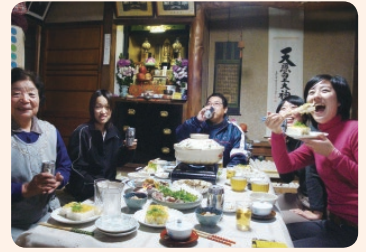
島の生活を体験できる「民泊」。「ぶち民家体験」として大人も体験できる

「体験してもらおうと考え民泊を提案したんです」 お客さんをおもてなしするようなのは何も…と及び腰だった島民を二軒一軒説得し、7軒の受け入れ先からスタート。実際始めてみると、宿泊する側だけでなく受け入れる側からも「楽しかった」という感想が聞かれたといいます。こうした評判は徐々に島民に広がり、現在受け入れ先は36軒にのぼっています。