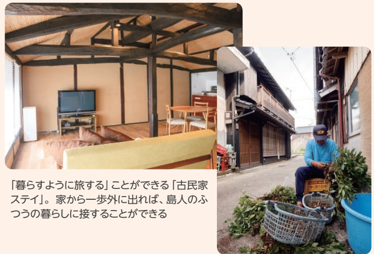
「暮らすように旅する」ことができる「古民家ステイ」。家から一步外に出れば、島人のふつ々の暮らしに接することができる

町が所有する江戸、明治、昭和初期の古民家6棟を離島体験滞在交流促進事業などを活用して改修。1棟1組の貸し切りとなっており、家族や友達同士で、楽しく島に暮らすように過ごせます。とはいえ、島民との触れ合いも体験して欲しいというこ