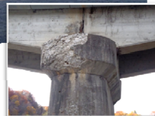
主桁・橋脚の損傷