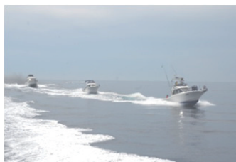
プレジャーボートクルージング

マリンレジャーの魅力を向上させていくためには、利用のための身近な拠点を整備することが必要である。誰でも、気軽に、安心して、楽しめる施設として「海の駅」は、陸と海とをつなぐ接点としての機能に加え、マリンレジャーを体験するために必要な情報、施設、機材を保有しており、マリンレジャー振興の「核」となる存在であり、海事局として「海の駅」の設置を推進している。2002年に最初の「海の駅」が登録されて以降2014年6月末時点において、全国に151駅が登録（2013-2014年度（6月末時点）は9箇所）の新規登録）されており、「海の駅」では、訪れた人が楽しめるよう、レンタルボートを利用したクルージングや海産物の販売、漁業体験等、地域の特性を活かした様々な取り組みが進められている。また、「海の駅」の設置拡大と並行して、その魅力の増大、取り組みの活性化、認知度の向上、防災・救難拠点としての活用など、地域と連携した活動が行われている。