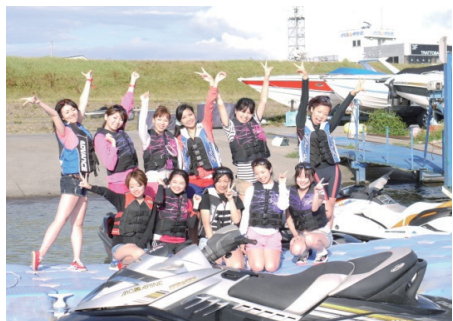
海なでしこによる水上オートバイツーリング

会」と連携し、マリンレジャー総合ポータルサイト「UMIちゃんねる ( http://www.uminikou.com )」により国民にマリンレジャーに関する情報を発信するとともに、マリンレジャー未経験の社会人・学生から結成された「海なでしこ」によりマリンレジャーの魅力を伝えるなどの取り組みを推進している。