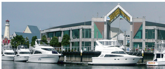
よこはま・かなざわ海の駅