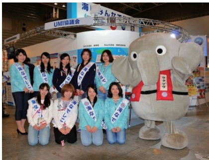
ボートショーへの出展