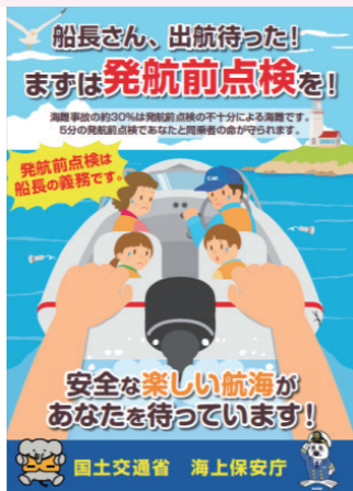
図表Ⅱ－5－5 発航前点検ポスター等

特に発航前点検を適正に行うことにより防止できる海難が多いため、発航前点検を重点的に実施している。