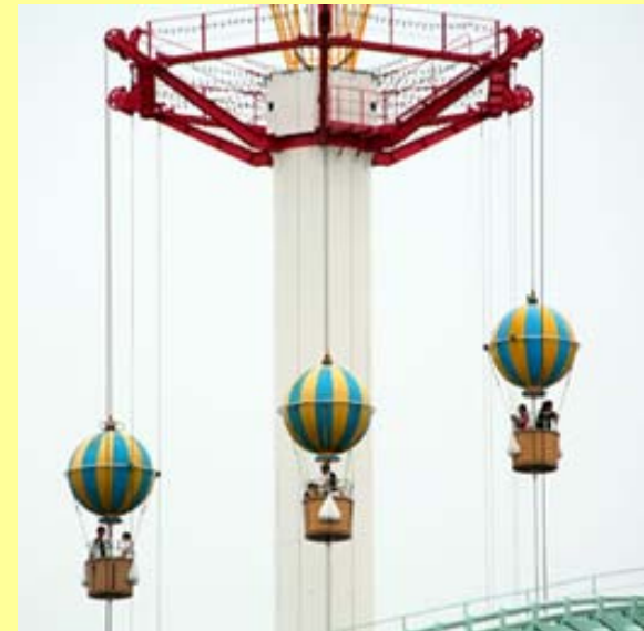
当該遊戯施設(遊園地のホームページによる)