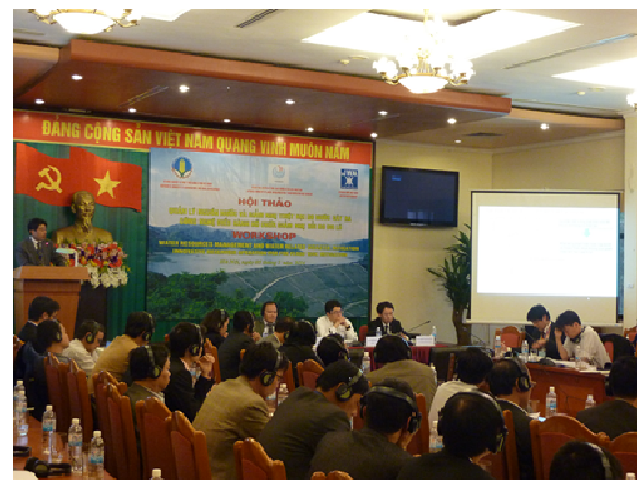
写真-2 日越ワークショップ開催

ワークショップの成果として、ベトナム側の貯水池管理におけるソフト（人材育成やマニュアル）・ハード（貯水池管理支援設備）のニーズが把握できたこと、農業農村開発省副大臣やベトナム側参加者と日本民間企業との交流が促進されたことや、発表や展示における個別技術に関してベトナム側から強い関心やアプローチが寄せられるなど、同国における民間企業展開に一定の支援ができた。