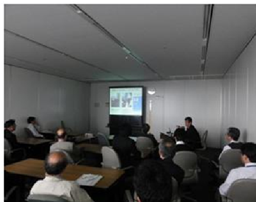
写真-2 国際業務報告会

国際会議参加や受託調査等の海外出張や、国際業務に関連した話題の報告として、平成25年度も国際業務報告会を本社にて計5回開催した。延べ28名の発表者から、海外出張の目的、活動内容、得られた成果等の情報が出張者以外へも共有されるとともに、当該出張を通じて得られたさまざまな水資源管理における課題とその対応手法、国際会議等での情報収集を通じた世界的な水に関する関心事、受託業務実施を通じた成果達成のためのアプローチ等、その情報共有を通じて機構の総合水資源管理等の知見・能力向上に寄与するとともに、参加者との間で活発な質疑・意見交換が行われた（写真-2）。なお、より広範な情報共有を図るため、報告会資料は機構内LAN上に掲載し、全職員が閲覧できるようにしている。