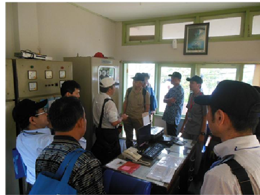
写真-1 インドネシアでのダムワークショップ及び現地調査