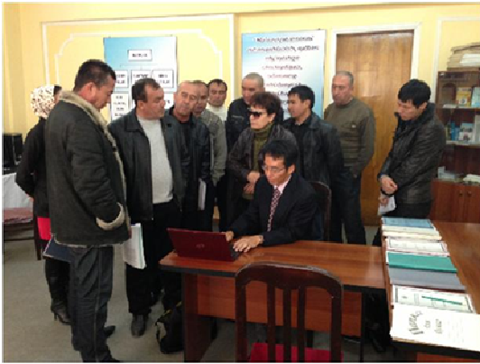
写真－4 水管理セミナー

平成25年11月28日には、TA7547による実証試験やセミナー開催等による能力開発の活動と水利構造物等の改修計画等の成果を共有するための国内ワークショップ（National Workshop）を開催し、関係機関から約40名が参加した（写真－5）。今後のウズベキスタンにおける水資源管理施設への対策の方向性について議論を深めた。機構としても、本業務を通じて水路や圃場における節水を進めるための課題と対策について技術力を向上させることができた。