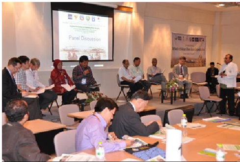
パネルディスカッション

TA7547チームリーダーによる概要報告、TA7547対象国からの成果報告、各国の課題とその対応策を共有するパネルディスカッションを行い、徐々に参加者に対してIWRMに関する課題認識を深めた上で、参加者全体を大きく4グループに分けたグループディスカッションを行った (写真-3)。