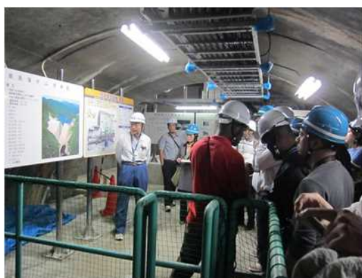
写真-1 総合水資源管理の研修