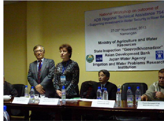
写真－5 国内ワークショップ