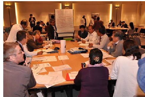
グループディスカッション