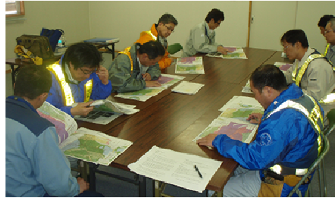
写真-1 津軽ダム 本体工事施工監理業務