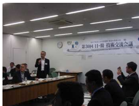
写真－2 第30回日韓技術交流会議