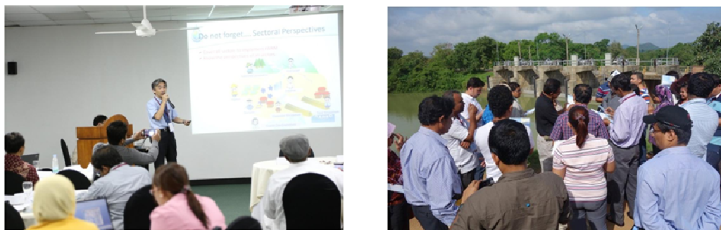
写真－4 NARBO主催の総合水資源管理研修

この研修において、機構は、IWRMガイドラインに基づくIWRMの概念、IWRMスパイラル（IWRMの発展過程における現状を認識するツール）、IWRM推進における課題解決の手法（key for success）を紹介した上で、具体的事例として機構の水資源管理の事例、スリランカのマハベリ川流域での取組事例の紹介を通じて参加者の能力向上を図った。今回の研修では、参加者募集のため、ADBとの連携を密にし、過去最大国数（11ヶ国）からの参加者を得た。参加者からは、IWRMに関する知識の向上、マハベリ川や参加者間での様々な事例を共有でき、また参加者同士のネットワークも構築できた、との評価を得た。