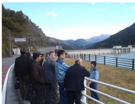
写真-2 ダムの安全管理能力強化の研修