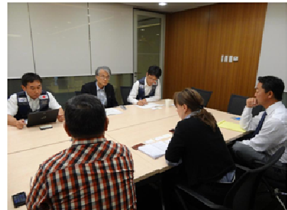
写真-1 フィリピン派遣

平成25年11月、台風30号（Yolanda）がフィリピンに上陸し、高潮などによる史上まれにみる大規模な被害をもたらした。これに対し、政府の要請を受け、国際緊急援助隊の一員として職員1名を派遣し、早期復興に向けた防災計画について、洪水被害対応に関する国内外での知見・経験や関係機関調整の経験に基づきアドバイスを行った（写真-1）。