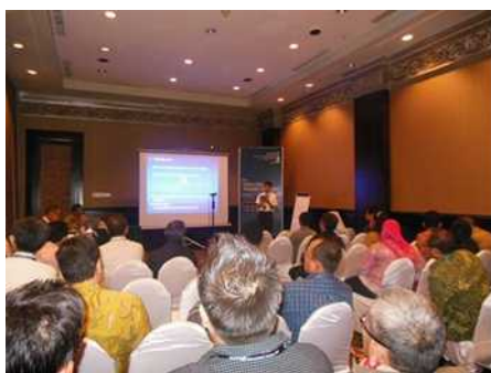
写真－1 インドネシア国際セミナー