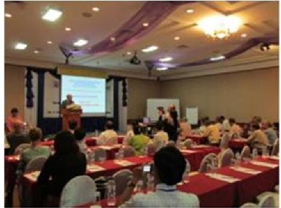
写真-2 ミャンマーワークショップ

機構は、機構の知見と経験を踏まえた総合水資源管理の実施方法について基調講演及びレクチャーを行ったほか、「ミャンマーにおける総合水資源管理の実施にあたり必要なものは何か」と題したパネルディスカッションを行い、機構及びNARBOの経験等を踏まえ、ミャンマーにおける総合水資源管理の実施のための適切な情報発信と支援を行った。