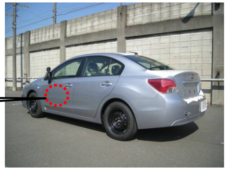
助手席補助ブレーキ装置