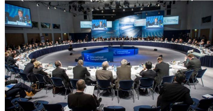
大臣セッションの様子