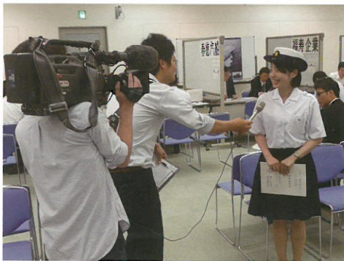
▶ 昨年の会場の様子