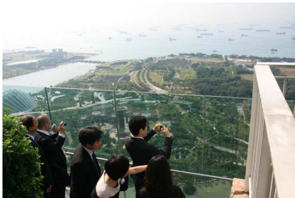
シンガポール：マラッカ・シンガポール海峡視察