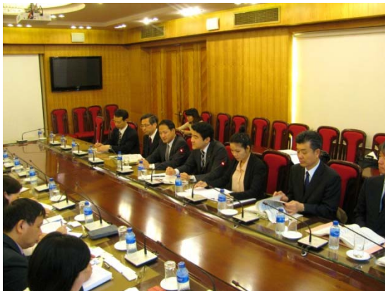
ベトナム：ファン・ティ・ミ・リン 建設省副大臣との会談

チャンギ空港（第4ターミナル）、マラッカ・シンガポール海峡、URA(シンガポール都市再開発庁)シティギャラリー、シンガポール港、トウアス造船所（海底油田掘削船等）