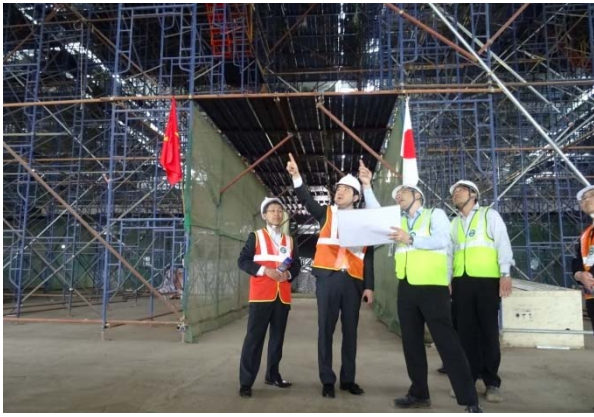
ベトナム：ノイバイ空港（第2ターミナル）視察