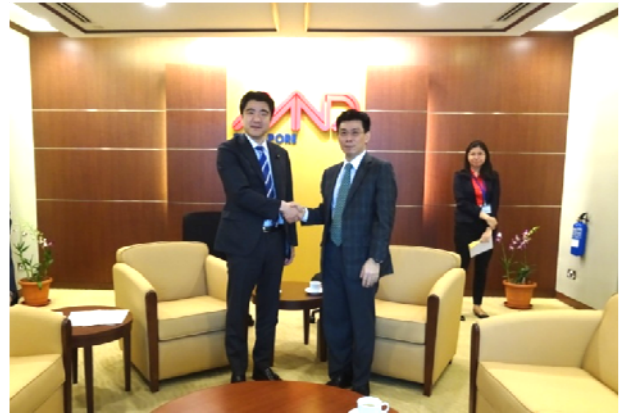
シンガポール：リー・イーシャン 貿易産業兼国家 開発担当上級國務大臣との会談