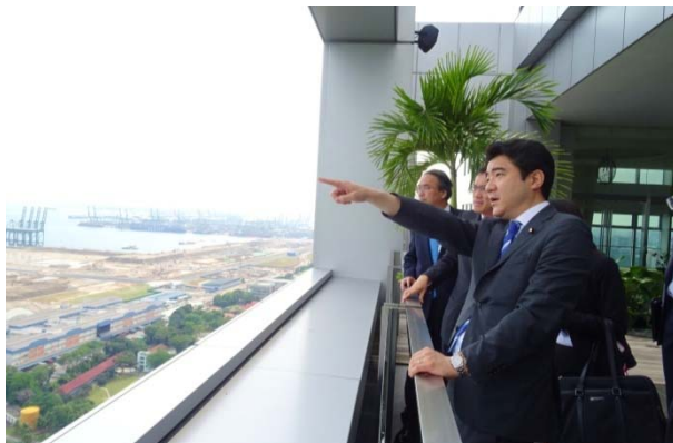
シンガポール：シンガポール港視察