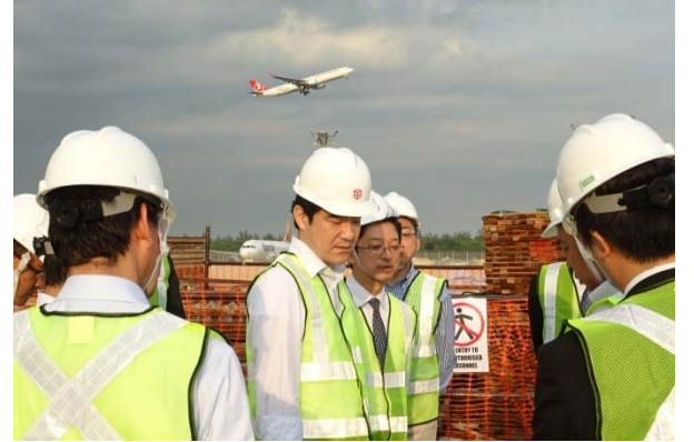
シンガポール：チャンギ空港（第4ターミナル）視察