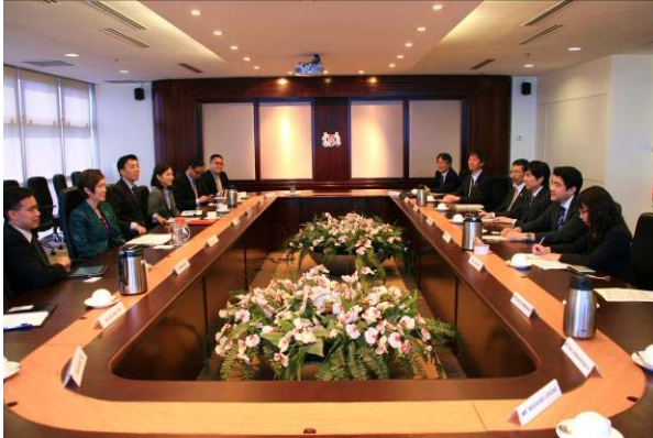
シンガポール：ジョセフィン・テオ 財務兼 運輸担当上級國務大臣との会談