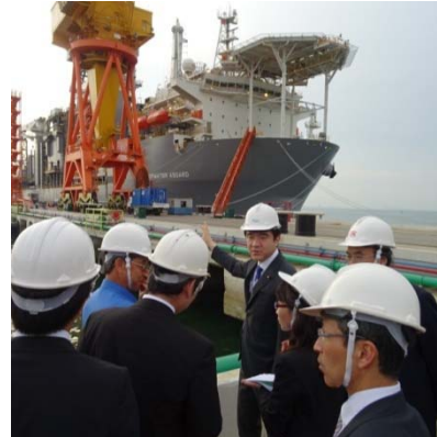
シンガポール：海底油田掘削船視察