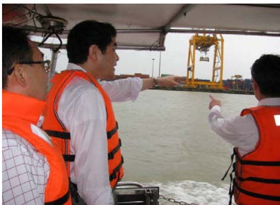
ベトナム：ハイフォン港視察