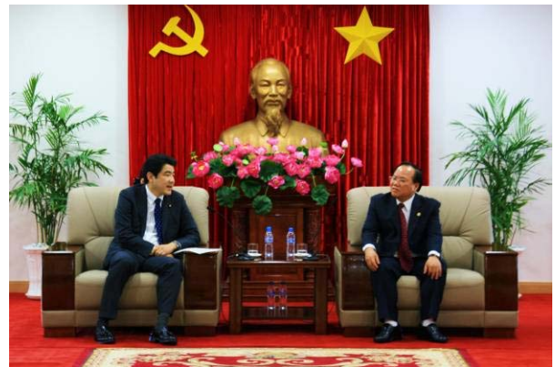
ベトナム：レー・タイン・クン ビンズン省 人民委員会委員長との会談