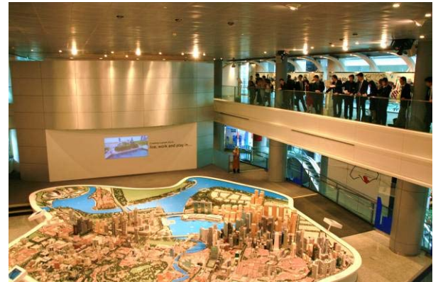
シンガポール：URA※シティギャラリー視察 ※URA (Urban Redevelopment Authority)：都市再開発庁