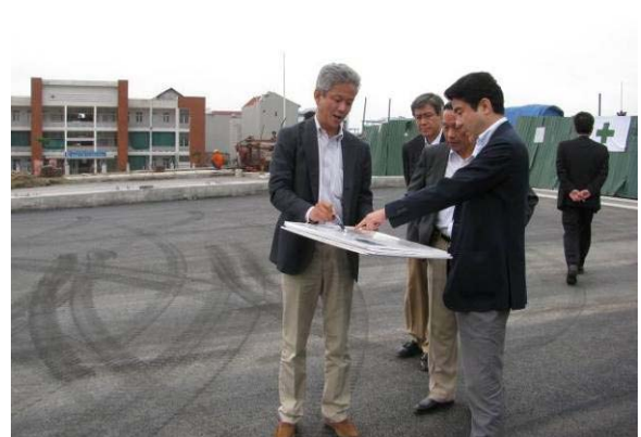
ベトナム：北ハノイ地区の視察