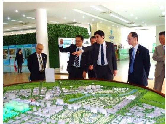
ベトナム：ビンズン新都市の視察