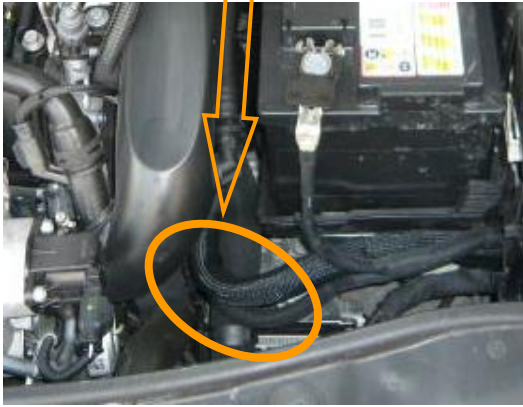
エンジン電気配線