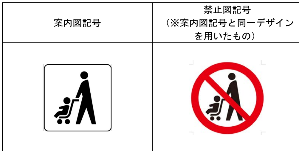
図1 選定したベビーカーマーク

理解度・視認性試験や国民意見の結果、また性差別の問題などを総合的に勘案し、案2を本協議会として選定するベビーカーマークとした。なお、デザインは、他の公共用案内用図記号と合わせるため、3.(1)の案2から微修整を行った。