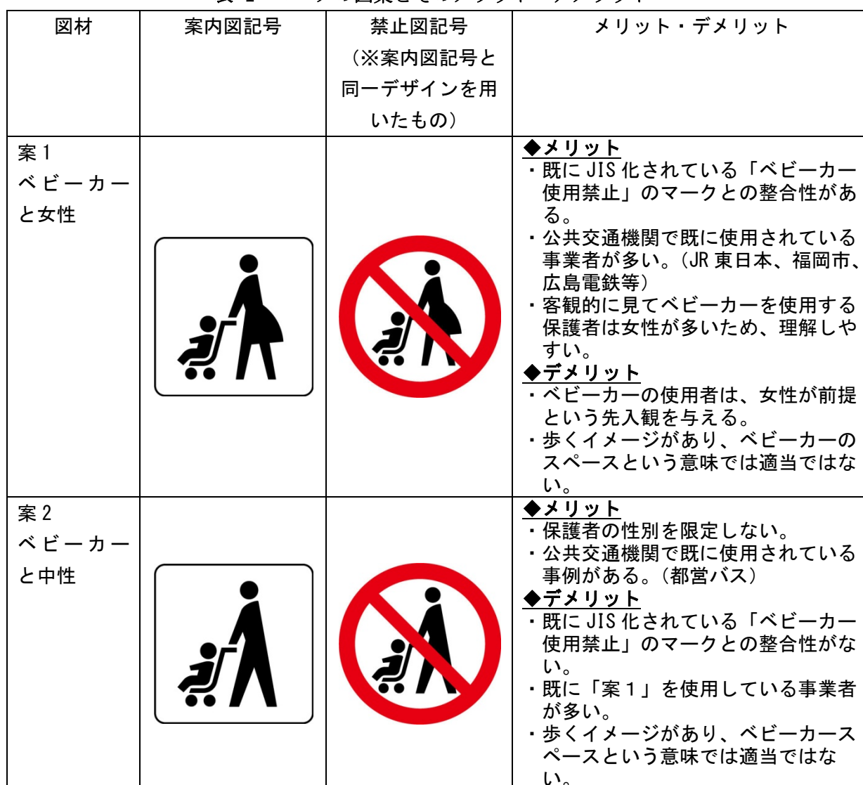
表 1 マークの図案とそのメリット・デメリット

ベビーカーに関するマークとして、現時点ではベビーカーと女性の絵を用いた禁止図記号（案1）のみが既にJIS化されている。この絵も参考に5案を提示し、それぞれのメリット・デメリットについて整理した。なお、文字による補助表示が必要な場合は図記号の中ではなく、必要に応じ図記号の外部に付記することとした。