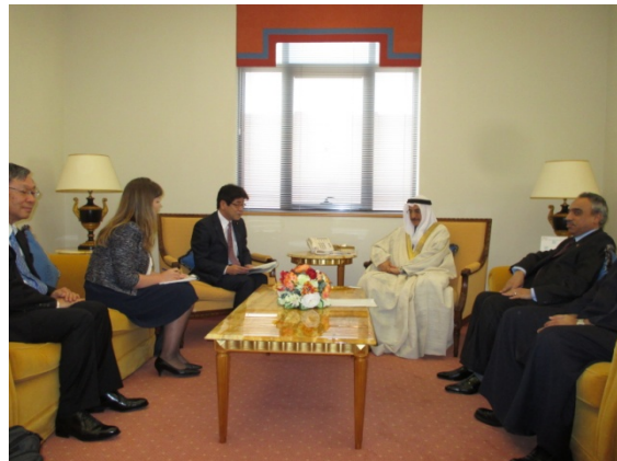
◇バーレーン： シェイク・ハーリド副首相との会談