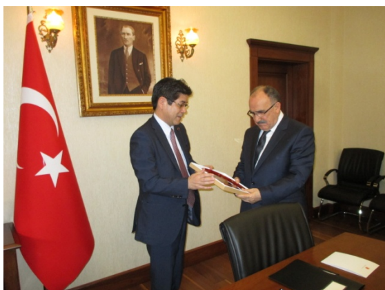
◇トルコ：アタライ副首相との会談

バルタ副大臣から、各都市の防災力強化を重点的に進めており、耐震性に問題のある650万戸の建物の再開発が必要など、災害に強い都市づくりに向けたトルコ側の防災上の課題が紹介された。また、環境都市省は、国や地域の上位計画や地方都市計画の基準などを策定しており、防災をどのように組み入れていくかについて、日本の経験やノウハウを提供して欲しいとの要請がなされた。引き続き、ワークショップの開催に向け、両国政府間で緊密に連携をはかることで一致した。