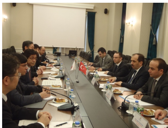
◇トルコ：バルタ副大臣との会談

連絡先 総合政策局海外プロジェクト推進課 担当 西・田中 代表 03-5253-8111 (内線 25807・25819) 直通 03-5253-8315 FAX 03-5253-1562