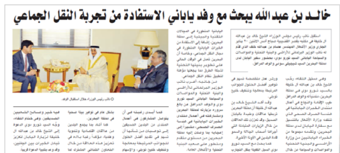
◇バーレーン：現地新聞での報道 (1/21)