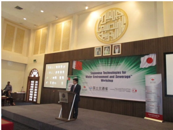
◇バーレーン： 水環境及び下水道に関する技術ワークショップ

土井政務官より、第1回の「水環境及び下水道に関するワークショップ」開催に関する公共事業省の協力について、謝意を述べるとともに、本ワークショップの成果を踏まえ、両国間の協力関係をより一層深化させていくことを確認した。ハラフ大臣からは、引き続き、下水道分野に関する日本の技術を紹介して欲しいとの要請がなされた。また、ハラフ大臣から、日本の都市交通や交通システムに関する新たなワークショップの開催要請がなされ、両国間で事務的に調整していくことで一致した。