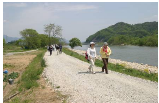
管理用道路をフットパスとして活用（最上川）

ハード支援： 治水上及び河川利用上の安全・安心に係る河川管理施設の整備を通じ、まちづくりと一体となった水辺整備を支援。