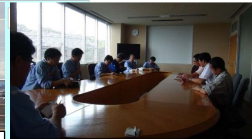
被災状況の把握と活動内容の確認 (大島支所)