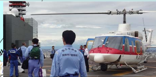
TEC-FORCE派遣状況 (関東地方整備局)