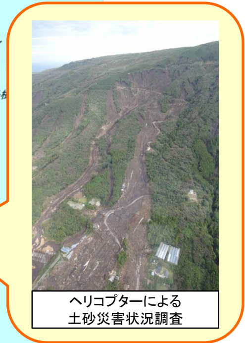
ヘリコプターによる 土砂災害状況調査