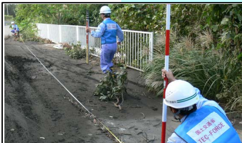
早期復旧に向けた被災箇所把握 (元町大金沢)