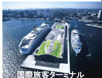
国際旅客ターミナル

○港湾では、民間企業(港湾運送事業者、製造業等)や行政関係(CIQ等)で働く人々や来訪者(観光、レジャー等)など、多様な人が活動する。