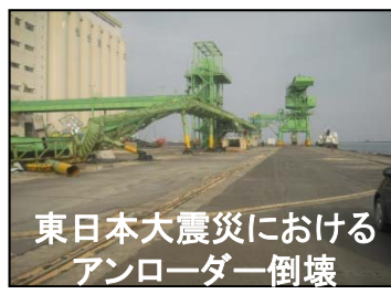
東日本大震災におけるアンローダー倒壊