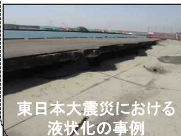
東日本大震災における液状化の事例

○港湾は高度成長期に埋め立てられた若齢地盤上に多くの機能が立地しており、地震による液状化被害が発生しやすい。