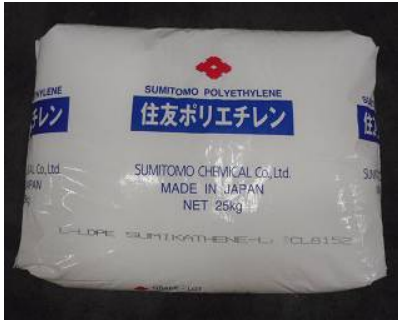
① スミカセン 【住友化学 株式会社】