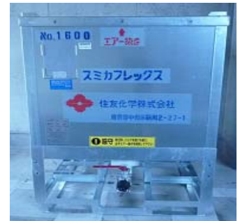
③ スミカフレックス 【住友化学 株式会社】