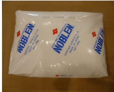
② ノーブレン 【住友化学 株式会社】