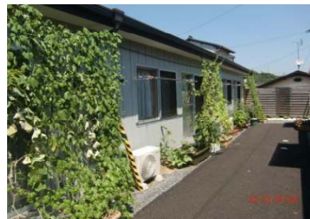
被災地の仮設住宅における取組報告