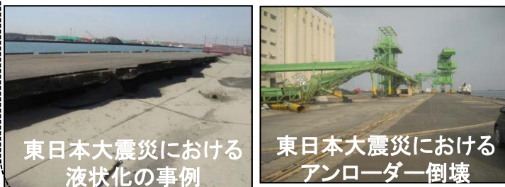
東日本大震災における液状化の事例

○港湾は高度成長期に埋め立てられた若齢地盤上に多くの機能が立地しており、地震による液状化被害が発生しやすい。