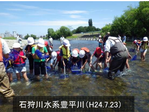
石狩川水系豊平川(H24.7.23)

平成24年度一級河川の全国水生生物調査では、夏休み期間を中心に、小中学校や市民団体等437団体、15,621人の多数の参加を頂き、505箇所の調査地点数となりました。参加者数の多い都道府県は、北海道、愛知県、兵庫県等でした。