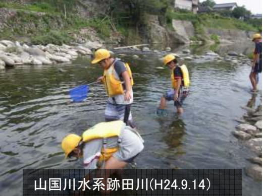
山国川水系跡田川(H24.9.14)