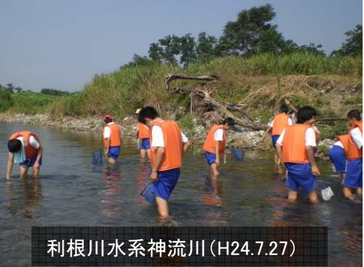
利根川水系神流川(H24.7.27)