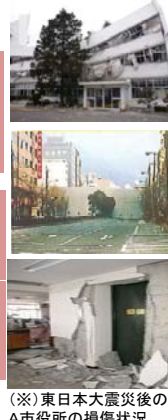
(※)東日本大震災後のA市役所の損傷状況