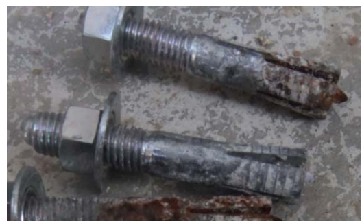
転倒後のアンカーボルト