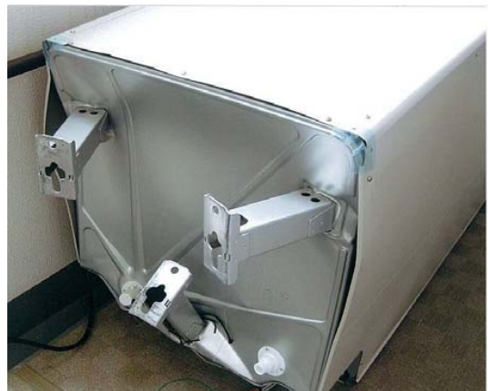
転倒した電気温水器の貯湯タンクの状況