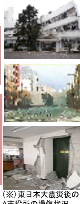
(※)東日本大震災後のA市役所の損傷状況