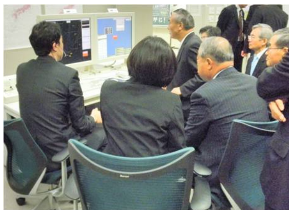
東京航空交通管制部での現地調査