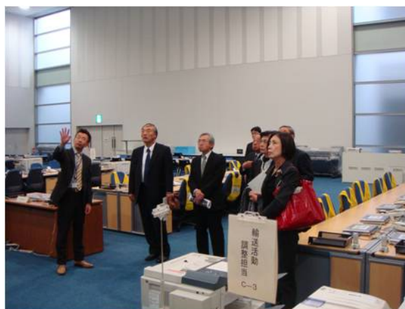
東京臨海広域防災公園（有明の丘基幹的防災拠点施設等）の現地調査