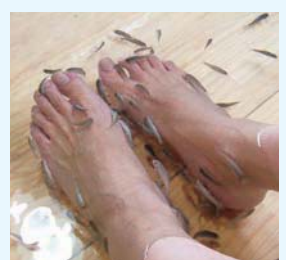
終わったあとはツルツルです!

英国では国が施設所に推奨するほど有名な「フィッシュセラピー」があります。古い皮膚角質を食べる魚の習性を利用した物理療法と、心理療法のセラピーでピーリング、マッサージ、リラクスの効果が。すべすべ肌になること間違いなし! http://mizunashi-honjin.co.jp