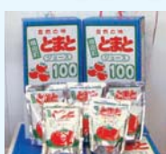
そのまま飲んでも、お料理に使ってもよし!

日本を代表する美女のひとり小野小町生誕の地。地元秋田産の「桃太郎」100%のとまとジュースは、ビタミンCや活性酸素を排出するリコピンも豊富で、アンチエイジングに効果的。 美人証明書も販売しています!! http://www.michinoeki-ogachi.co.jp