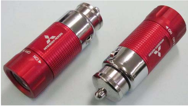
(三菱純正リチャージブル LED ライト外観形状)