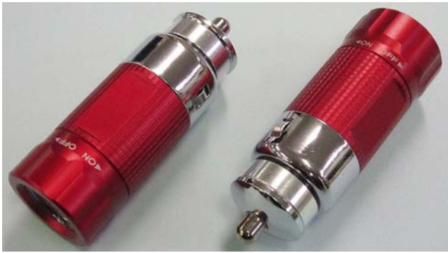
(ダイハツ純正アクセサリースOCKETライト外観形状)