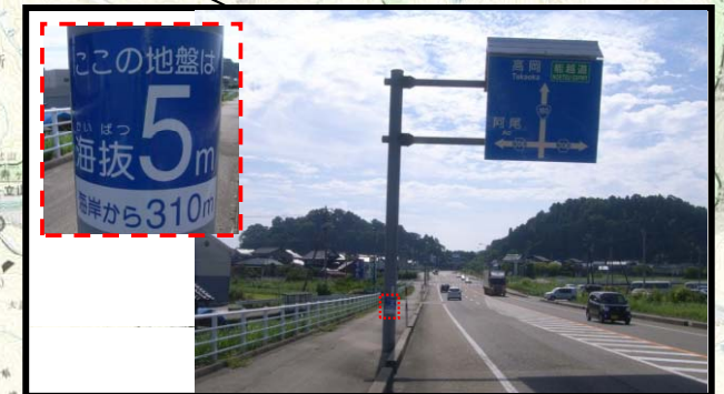
国道160号 氷見市海峰小学校口交差点付近