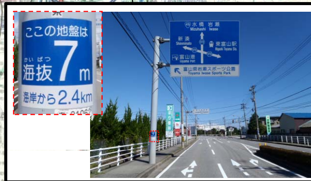
県道八幡田稲荷線 富山市東富山駅前交差点付近