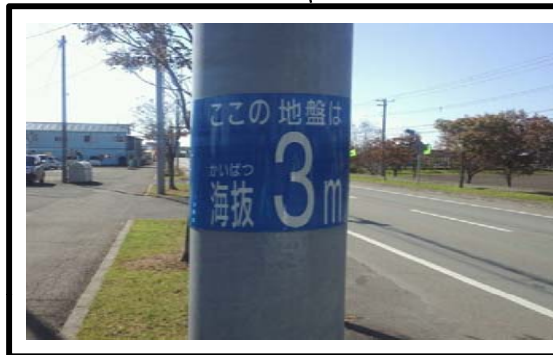
〈国道236号 浦河町西幌別〉