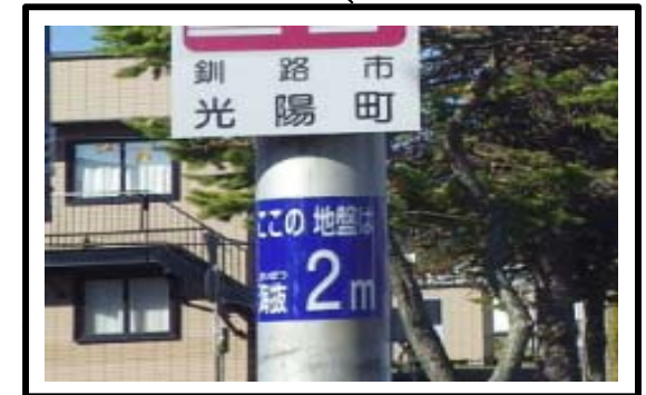
〈主要地方道釧路環状線 釧路市光陽町〉