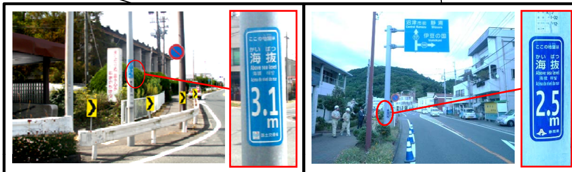
〈国道1号新居支所前交差点付近〉