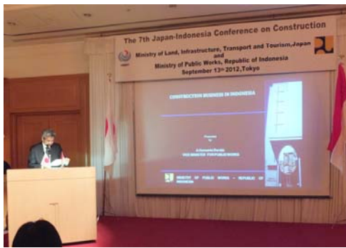
ヘルマント 公共事業省副大臣の基調講演