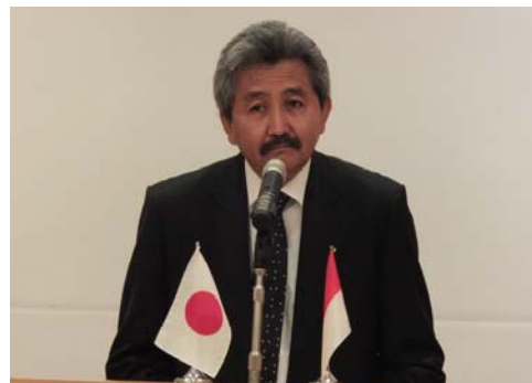
ヘルマント公共事業省副大臣の開会挨拶