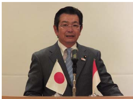
奥田建国土交通副大臣の開会挨拶