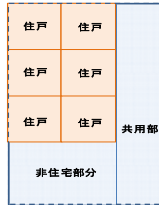
(住宅を含む建築物)