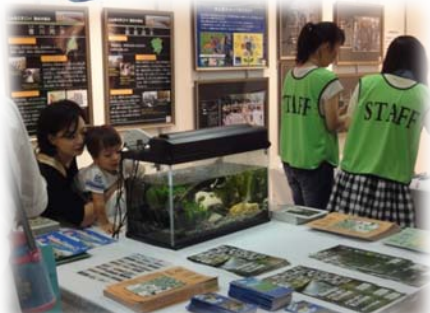
疏水の恵みを未来へ 継承していこう