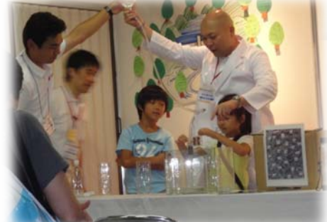
エコ×エネ体験プロジェクト