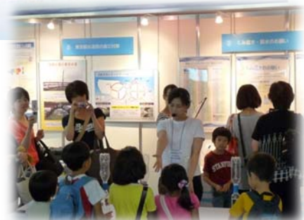
なるほど！ だから「安心」東京水