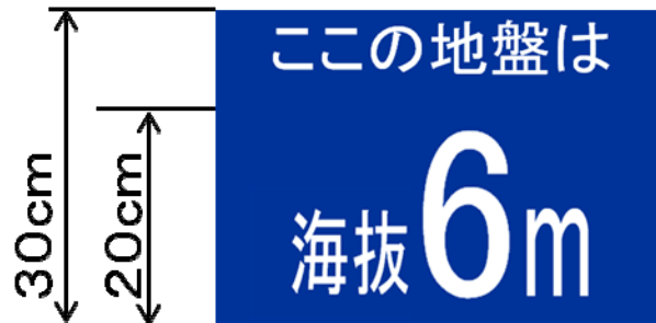
図1 海拔表示シートの様式案