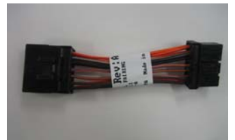
対策品 (前部雾灯用ハーネス)