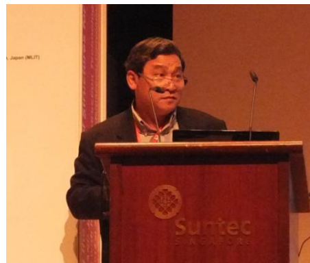
タン・ティアン・チョン シンガポール建築建設庁局長