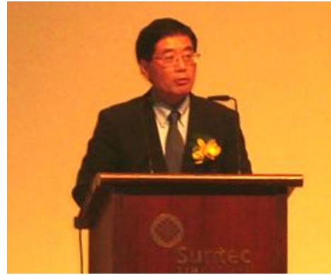
鈴木庸一駐シンガポール日本国大使の開会挨拶