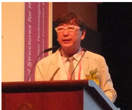
伊東豊雄氏・建築家