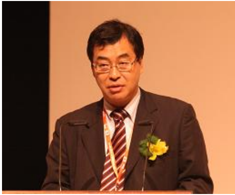
佐々木基建設流通政策審議官の開会挨拶