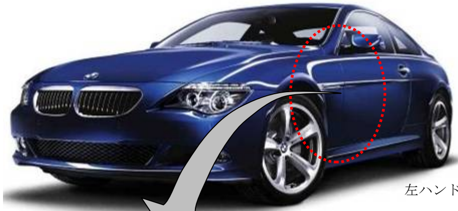
左ハンドル車で説明