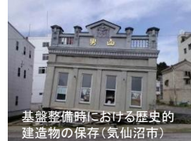
基盤整備時における歴史的建造物の保存(気仙沼市)