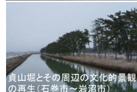
貞山堀とその周辺の文化的景観の再生(石巻市～岩沼市)