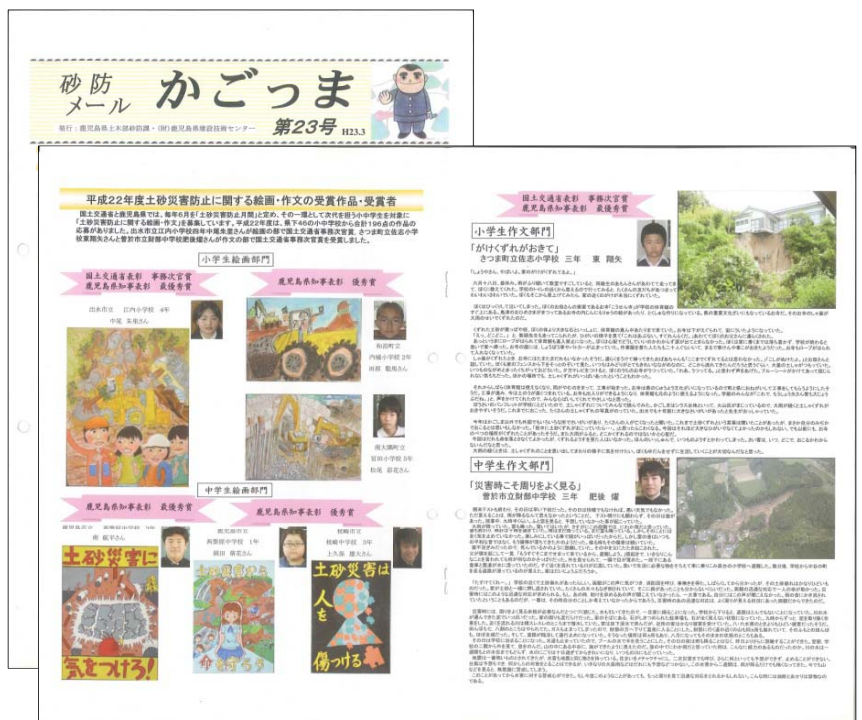
広報誌への掲載(一例) (鹿児島県発行:砂防メール「かがっま」)