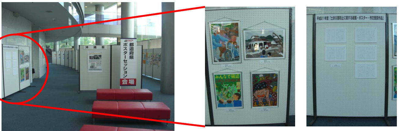
土砂災害防止「全国の集い」会場に展示 (写真はH22年度「全国の集い」)

また、都道府県においても、優秀作品等については、パネル展などの各種イベントでの展示や広報誌への掲載等幅広く、活用されています。 (※作品の著作権は国土交通省及び都道府県に帰属)