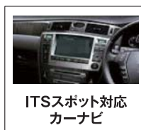
ITSスポット対応 カーナビ