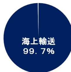
輸出入貿易量(トン数ベース)の海上輸送への依存割合