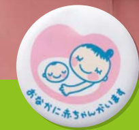
マタニティマーク

座席は必要な方にゆずりましょう ○お年寄り ○お身体の不自由な方 ○乳幼児をお連れの方 ○妊娠されている方 など